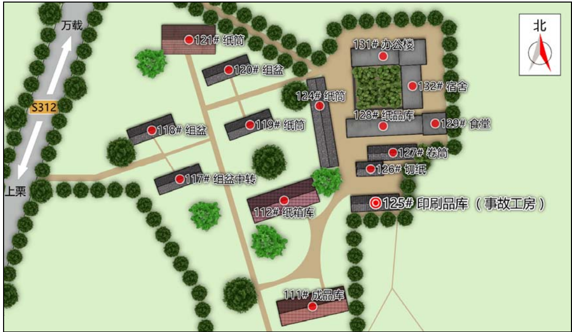
图 1 事故工房周边建筑示意