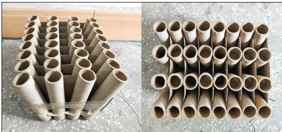
图 2 32 发扇形小型地面礼花产品外观

品库库房内及走廊共堆放有当时生产的 32 发扇形小型地面礼花 ① 产品（产品外观见图 2）约 400 个，总药量约 178 千克。